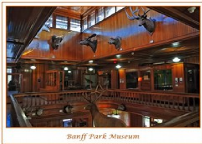
Banff Park Museum