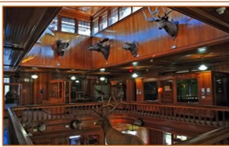
Banff Park Museum